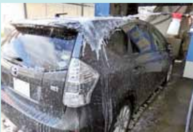
▲ 洗車には洗車機を使用します