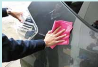
▲ 専用クロスを使用して真心を込めて拭き上げます