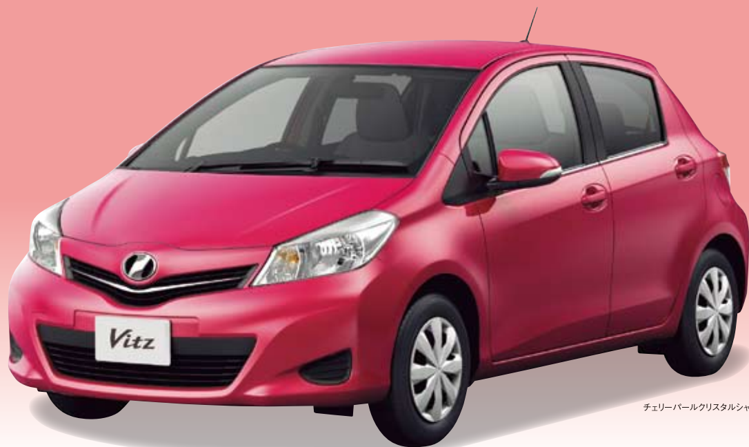
チェリーパールクリスタルシャイン